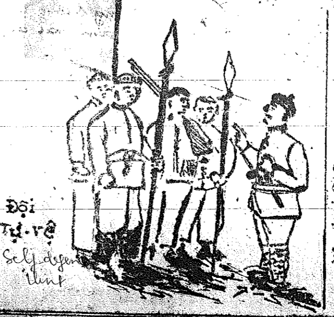
Đội tử vệ Self defense unit

đem làm giầy! thêu khăn biếu chúng tôi. Lòng thần ái đó, không bao giờ chúng tôi quên, anh em công nhân, nông dân, thanh miên và các đồng bào dân tộc thiếu số ai cũng yêu mến và trung thành với đoàn thể, với Lãnh tụ. Chúng tôi sẽ nhớ luôn luôn các đồng chí trong các đội tử vệ, ai cũng hoạt bát hùng