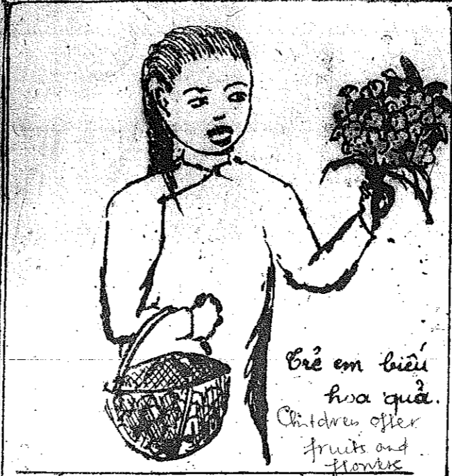
Bé em biếu hoa quả. Children offer fruits and flowers

Pháo này vàng phải cắt cho kim đao Hào không có cho cắt thì đứt Đoàn lễ về vàng hay nên đọc Đoàn lễ về vàng hay nên đọc Đoàn lễ về vàng hay nên đọc Đoàn lễ về vàng hay nên đọc