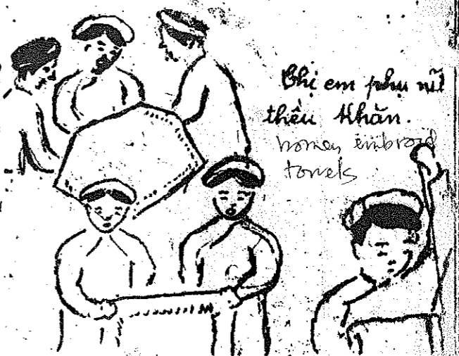
Bé em phụ nữ thêu khăn. Women embroider towels

Chương lúc chúng tôi vắng lính Đoàn thể đi tuần thi các lính, tôi đâu cũng được anh chị em nhiệt liệt hoan nghênh. Chúng tôi cảm ơn vô cùng! Bác út già "Lão nhân cứu quốc hội" và các trẻ em "Nhi đồng cứu quốc hội" cũng hơn hớn gặp chúng tôi, tay bắt mặt mừng, cho em phụ nữ thêu cá