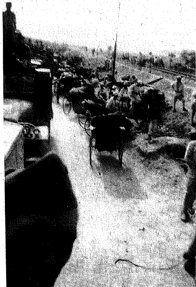
Quân Quốc dân đang rút về Hải Phòng ngày 7-7-1946, chúng dùng cả xe kéo để vận chuyển đồ đạc. Đi ngược lại là đoàn xe của quân Pháp hướng về Lạng Sơn.