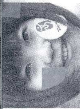
For Kina: Kinesere ser aksjonene mot fakkelfstafetten som ydmykelse av Kina.

Japan bestemte seg for å sette økonomisk vekst foran alt annet, og holde seg inne med USA. Japan bestemte seg i 1945-46, vedtok en fredsgrunnlov og har fulgt etter i 1967 da nasjonalistlederen Sukarno ble avsatt og general Suharto tok over med et team av økonomer fra Harvard. Hans indre fred hvilte på undertrykkelse, mens ytre fred ble sikret gjennom samarbeids-