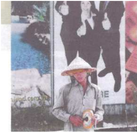
Vietnam: En av finanskrisens tapere.

Det internasjonale pengefondet (IMF) offentliggjorde nylig en rapport som konkluderte med at lavinntektslandene – stort sett land som er fattigere enn Economists 17 – vil trenge en innsprøytning på minst 25 milliarder dollar i 2009 for å kunne holde seg finansielt flytende. IMF utpeker 26 særlig utsatte land. Blant dem er man-