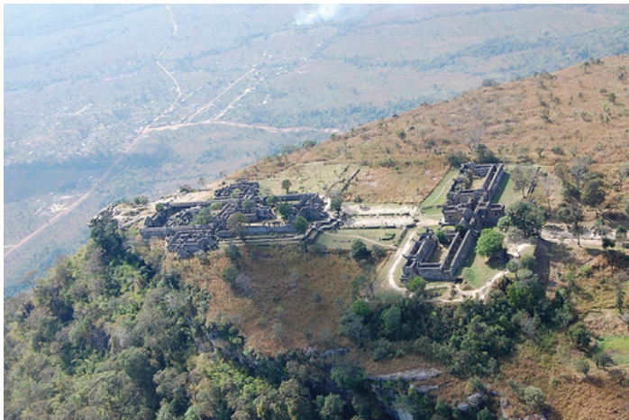
Tempelet Preah Vihear

Rødskjorte-bevegelsen (Den forente fronten for demokrati mot diktatur) ble organisert i 2006 som en reaksjon mot militærkuppet. Den kjemper for de fattiges rettigheter og for å gjeninnføre demokratiet. Mange i bevegelsen vil ha Thaksin tilbake. Rødskjortene står sterkt i det folkerike Nord- og Nordøst-Thailand og dessuten blant innflytterne i Bangkok.