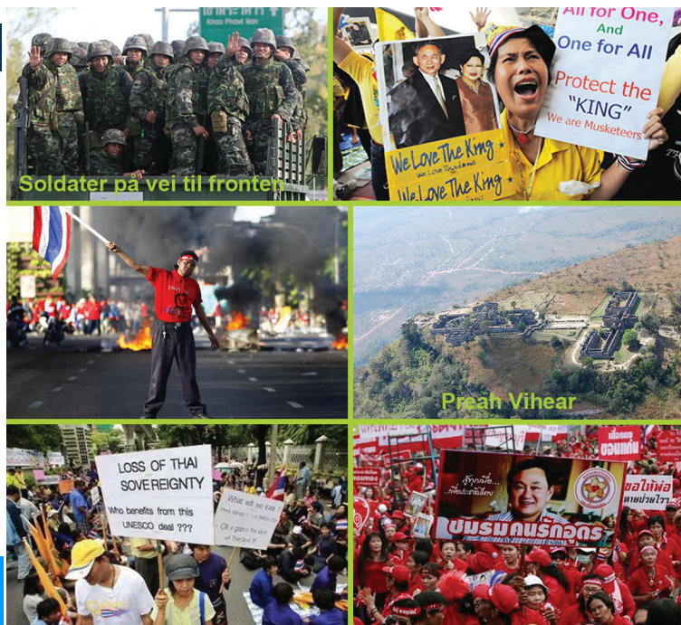
Sider ved konfliktenes Thailand

På en klippe nord i Kambodsja, nær Thailand, ligger tempelet Preah Vihear. Det er ett av de mange flotte